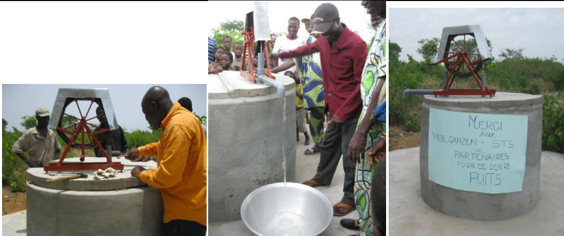
installatie van de touwpomp en "opening" van de put door de chieft.