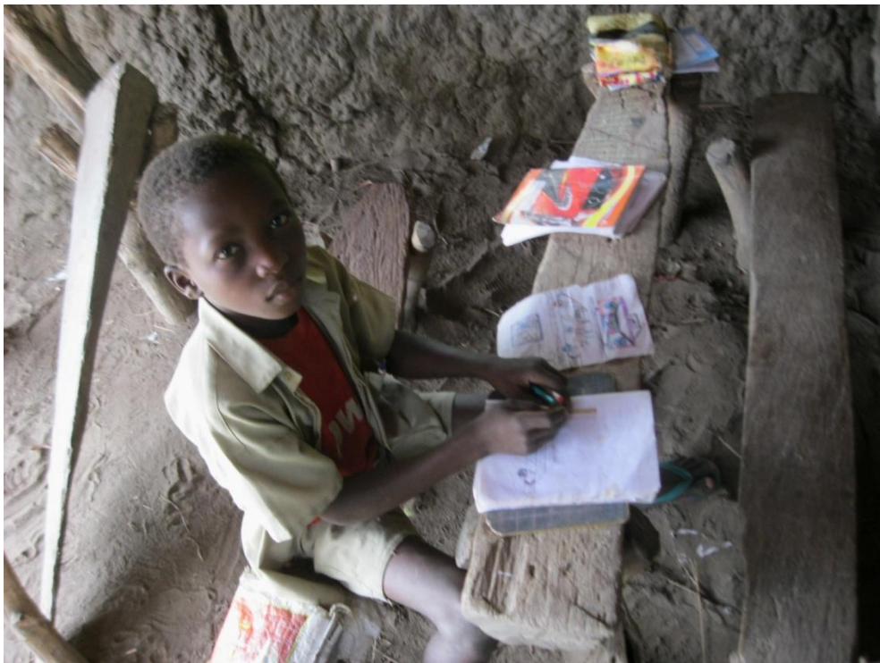
De school is aan vernieuwing toe: het dak lekt en waait weg als er veel wind is..., de vloer is niet van cement, dus modderig....