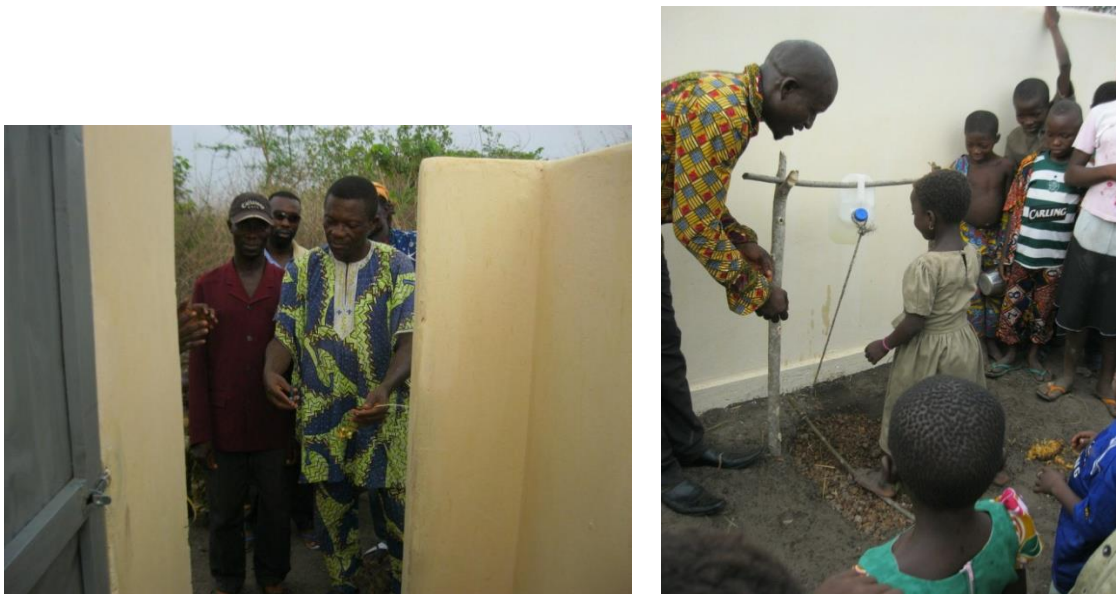
Bouw en opening van de eerste latrine in de buurt van de school. De kinderen krijgen handenwas-les bij de tippy-tap!